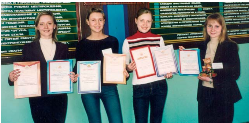
НА ФОТО: Участники и победители Межрегиональной олимпиады по бухгалтерскому учету, анализу и аудиту. Новокузнецк, 2005 г.

■ Преподаватели и студенты факультета бизнеса