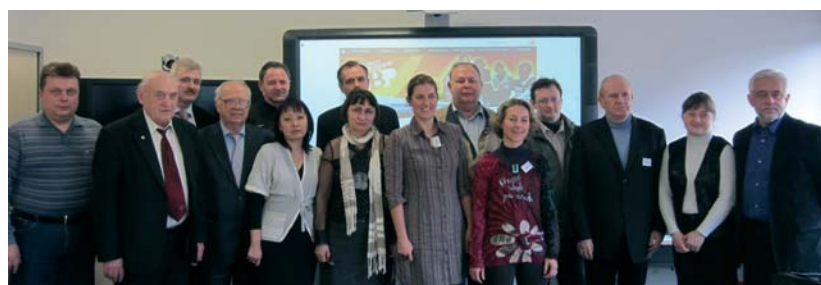
ФОТОГРАФИЯ ПРЕДОСТАВЛЕНА МЕЖДУНАРОДНОЙ СЛУЖБОЙ

НАЦИОНАЛЬНЫЙ ОФИС TEMPUS В РФ / ПРОЕКТЫ TEMPUS: HTTP://WWW.TEMPUS-RUSSIA.RU/PROJ.HTM