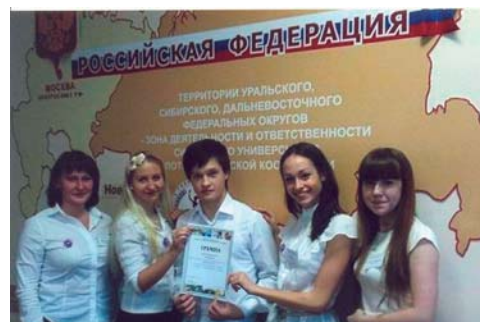
НА ФОТО: Команда НГТУ — победитель межвузовской олимпиады по аудиту и экономическому анализу. Новосибирск, СибГУТИ, 2011 г.

Особую гордость кафедры вызывает конкурс «Лучший молодой бухгалтер Новосибирской области», проводившийся по инициативе Института профессиональных бухгалтеров и аудиторов России. В 2010 году студенты НГТУ заняли 2 командное место и 3 место в личном первенстве, 5 студентов стали лауреатами;